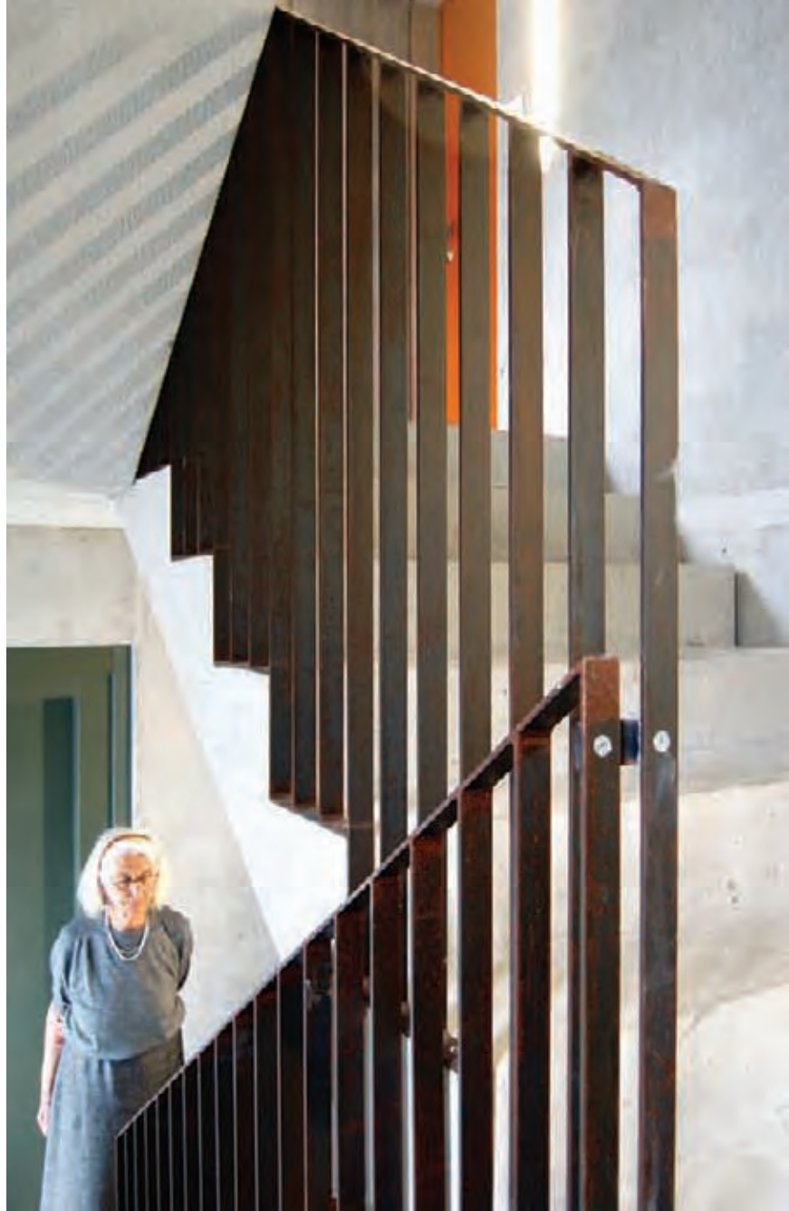
Habitat collectif à CH-Willisau bilan énergétique positif et certifié Minergie-P® Architecte/photographe : Pierre Honegger